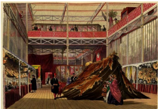
Le pavillon de la Tunisie. Dickinson's Comprehensive Pictures of The Great Exhibition of 1851, Londres, Her Majesty's Publishers, 1854.