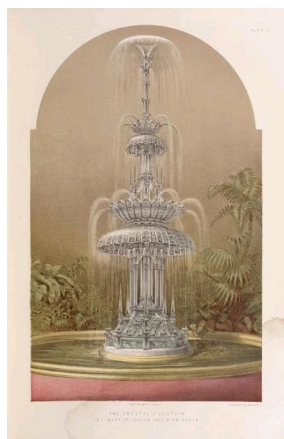
Osler, Fontaine de cristal créée pour le Crystal Palace, 1851, Bibliothèque municipale de New-York.

Dans un contexte de révolution industrielle, d'épanouissement du capitalisme et du libre-échange, les expositions industrielles , d'abord nationales, permettent de partager les inventions qui ouvrent les horizons du futur. En 1849, l' Exposition des Arts et Manufactures Industriels à Birmingham ouverte par le Roi Albert donna à ce dernier l'idée d'élargir ce concept à l'échelle internationale, afin de pouvoir confronter les progrès de toutes les nations. Ainsi la première Exposition Universelle se tint à Londres du 1er mai au 15 octobre 1851 au Crystal Palace . Le règne de Victoria démontra ainsi sa modernité et son adhésion à une philosophie libérale, où le commerce international serait garant de la paix et de l'épanouissement du génie humain.