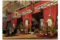
Pavillons de l'ameublement. Dickinson's Comprehensive Pictures of The Great Exhibition of 1851, Londres, Her Majesty's Publishers, 1854.