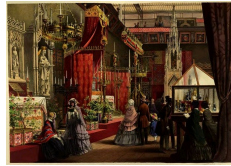
Le « Medieval Court ». Dickinson's Comprehensive Pictures of The Great Exhibition of 1851, Londres, Her Majesty's Publishers, 1854.