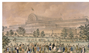
Vue extérieure du Crystal Palace