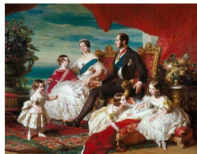
Franz Xaver Winterhalter, La famille de la Reine Victoria, 1846, The Royal Collection, Buckingham Palace.