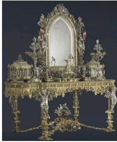
François-Désiré Froment-Meurice, Toilette de la Duchesse de Parme, 1847, musée d'Orsay, Paris.