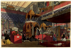
Le pavillon de l'Inde. Dickinson's Comprehensive Pictures of The Great Exhibition of 1851, Londres, Her Majesty's Publishers, 1854.