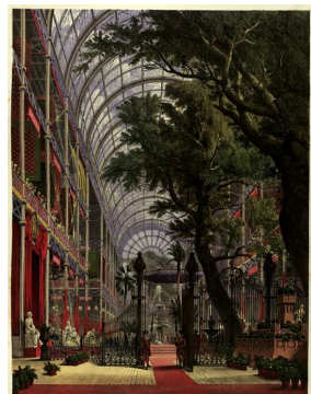
L'entrée de l'Exposition et arbre centenaire. Dickinson's Comprehensive Pictures of The Great Exhibition of 1851, Londres, Her Majesty's Publishers, 1854.