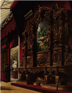
Exposition de l'ébéniste Fourdinois au pavillon de France. Dickinson's Comprehensive Pictures of The Great Exhibition of 1851, Londres, Her Majesty's Publishers, 1854.