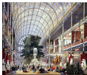
Nef principale du Crystal Palace pendant l'Exposition Universelle de 1851.