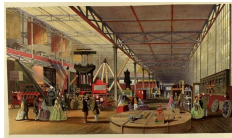
La section des Machines. Dickinson's Comprehensive Pictures of The Great Exhibition of 1851, Londres, Her Majesty's Publishers, 1854.