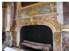
Cheminée du Salon d'Hercule par Antoine Vassé.