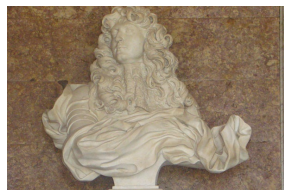
Buste de Louis XIV par Le Bernin