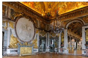
Le Salon de la Guerre du Château de Versailles