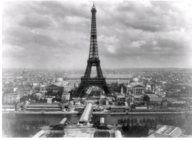
La vue sur la Tour Eiffel lors de l'Exposition Universelle de 1889.