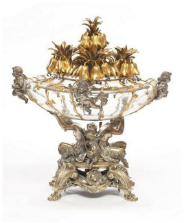
Froment-Meurice, François Carlier, Coupe du surtout de table commandé par Napoléon III, 1867, Musée des Arts Décoratifs, Paris.