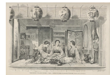
Intérieur de la maison du gouverneur de Satzouma, gravure du Monde Illustré, 1867.