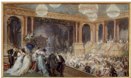
Antoine Baron, Fête officielle au Palais des Tuileries pendant l'Exposition Universelle de 1867, 1867, Palais de Compiègne.