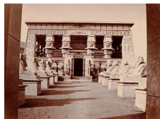
Temple d'Athor, photographie de Pierre Petit, Archives nationales.