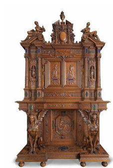
Henri-Auguste Fourdinois, Cabinet à deux corps, Grand prix de l'Exposition Universelle de 1867, Musée des Arts Décoratifs, Paris.