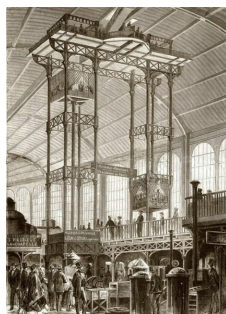
Les ascenseurs hydrauliques de Léon Edoux, Bibliothèque Nationale de France.