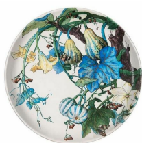
Théodore Deck et Eléonore Escallier, Plat, 1867, Musée des Arts Décoratifs, Paris.