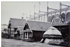
Isbas russes dans le parc de l'Exposition, photographie de 1867.