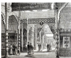
Pavillon de la Tunisie et du Maroc