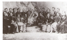
La délégation japonaise autour de Tokugawa Akitake, illustration du Monde Illustré, 1867.