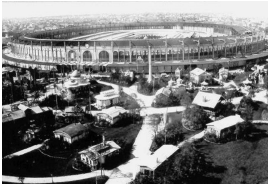
Vue sur le Palais Omnibus et le Parc, Exposition Universelle de 1867, Paris.