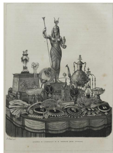
Exposition du joaillier Baugrand, « Les Merveilles de l'Exposition Universelle », illustration de presse, 1867, RMN.