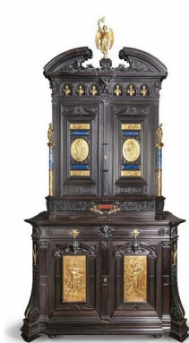
Antoine Kneib, Jules Dalou, Cabinet, médaille d'argent de l'Exposition Universelle de 1867, Musée des Arts Décoratifs, Paris.