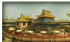
Pavillon de la Chine, reconstitution.