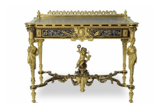
Christofle et Cie, sculptures de Carrier-Belleuse et Joseph Chéret, Table de toilette de Gustave Pereire, 1867, Musée des Arts Décoratifs, Paris.