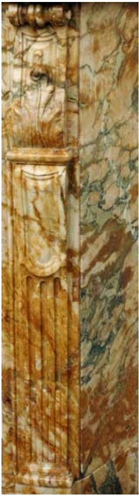
Détail d'une Brèche du Benou