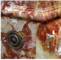
Détail d'une Brèche de Saint-Maximin