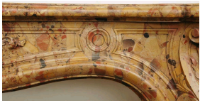
Détail d'une Brèche d'Alep