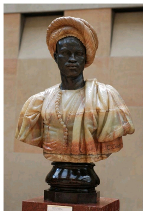
Le Nègre du Soudan, sculpture de Charles Cordier.