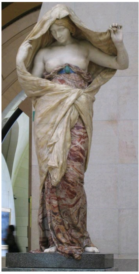
La Nature se dévoilant devant la Science de Barrias, Musée d'Orsay, Paris.