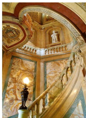
L'escalier en onyx de l'Hôtel de la Païva, Paris.

Il a été beaucoup utilisé pour la fabrication de tables à café et de petits objets d'art. On le retrouve plus rarement pour la réalisation de cheminées.