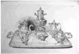
Catalogue de la maison Boin Taburet de 1893