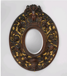
Cadre sculpté par Egisto Gajani, 1870, Metropolitan Museum, New York, USA.

Au cours de sa carrière, il participa à la fondation et à la direction de l'Ecole pour sculpteurs sur bois, ébénistes et menuisiers de Florence et, à partir de 1870, il fut membre de l'Académie des Beaux-Arts de Florence.