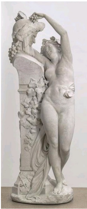
Carrier-Belleuse, La Bacchante, 1863, achetée par Napoléon III, Paris, Musée d'Orsay.