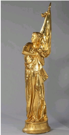
Carrier-Belleuse, Mlle Rachel chantant la Marseillaise, 1848, collection Walewski.