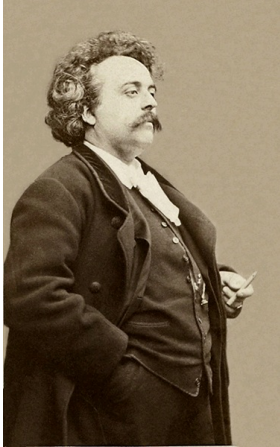
Etienne Carjat, portrait d'Albert-Ernest Carrier-Belleuse, Paris, BNF.

Albert-Ernest Carrier de Belleuse dit Carrier-Belleuse (1824 - 1887) est le sculpteur le plus prolifique du Second Empire , qui touche à tous les domaines de la sculpture, des porcelaines de Sèvres à la sculpture monumentale de marbre, en passant par une importante production de terres cuites et statuette de bronze.