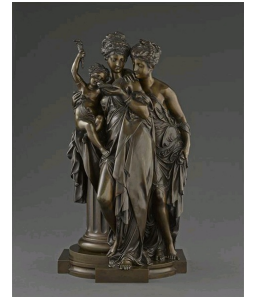
Carrier-Belleuse, La lecture, Musée national du Château de Compiègne.