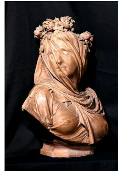
Carrier-Belleuse, Vestale voilée, 1859, Musée d'art et d'archéologie de Laon.