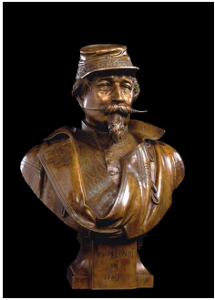
Carrier-Belleuse, Napoléon III en Italie, 1859, Musée de Saint-Germain-en-Laye.