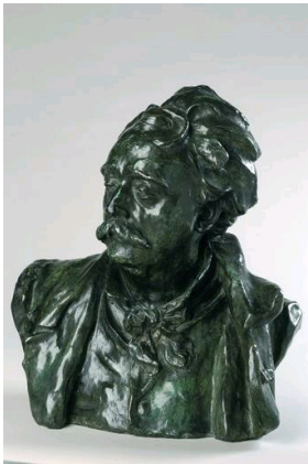
Auguste Rodin, Buste de Carrier-Belleuse, 1882, Paris, Musée Rodin.