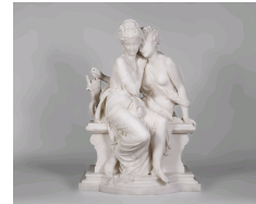
Carrier-Belleuse, La confiance, 1872-1874, Galerie Marc Maison.