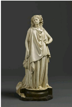
Carrier-Belleuse, La comtesse de Castiglione en costume de Reine d'Etrurie, 1864, Musée national du Château de Compiègne.