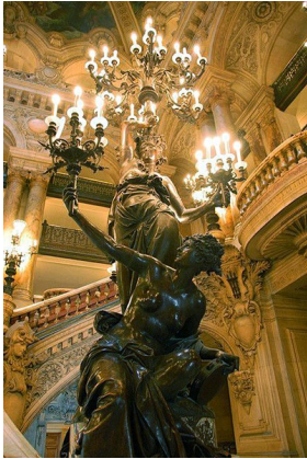
Carrier-Belleuse, Torchères de l'Opéra Garnier, Paris.