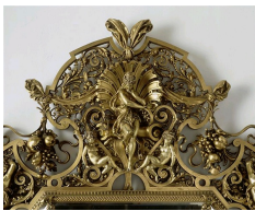
Miroir monumental de la Maison Barbedienne pour l'Exposition Universelle de 1867 (tirage de 1878), figures sculptées de Carrier-Belleuse, Paris, Musée d'Orsay.