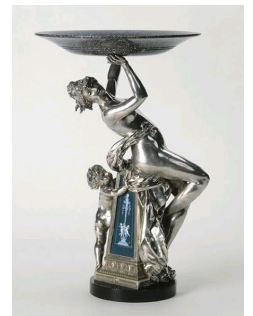
Coupe, sculptures de Carrier-Belleuse, ciselure de Marioton, émail de Doat, 1886, Paris, Musée d'Orsay.