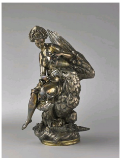
Carrier-Belleuse, Hébé et l'aigle de Jupiter, 1858, Paris, Musée d'Orsay.