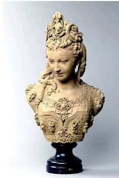
Carrier-Belleuse, Buste de femme portant un diadème, vers 1860-1870, Paris, Musée d'Orsay.