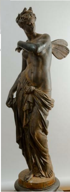
Néréide, Salon de 1870, fonte du Val d'Osne, Musée municipal de Saint-Dizier.