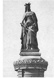
Marguerite d'Anjou, Salon de 1902.