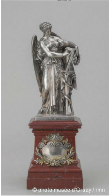
Modèle de Mathurin Moreau pour Christofle, « La Renommée inscrivant sur une tablette d'or la date de l'Exposition en 1866 », Paris, Musée d'Orsay.