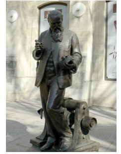
Zénobe Gramme, électricien, 1902, Paris, Musée des Arts et Métiers.