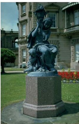
L'Hiver, offert à la Reine Victoria en 1855, Osborne House, The Royal Collection, Londres.