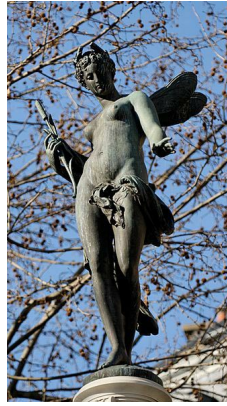
Nymphe fluviale de la fontaine du Théâtre-Français, 1874, rue Richelieu, Paris.