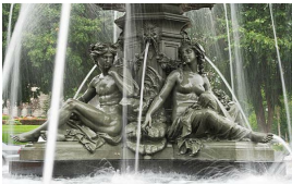
Fontaine de Tourny, Médaille d'or de l'Exposition Universelle de 1855, Parlement de Québec.