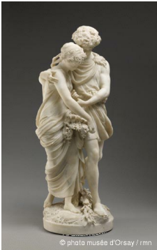
Daphnis et Chloé, Paris, Musée d'Orsay.