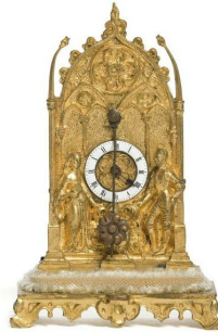
Pendule Troubadour, 1835-1850, Musée des Arts Décoratifs, Paris.