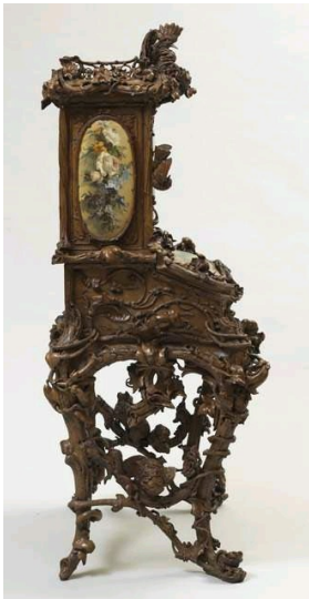
Bonheur du jour de l'Impératrice Eugénie, présenté à l'Exposition Universelle de 1855, Château de Compiègne.