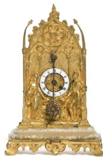
Pendule Troubadour, 1835-1850, Musée des Arts Décoratifs, Paris.