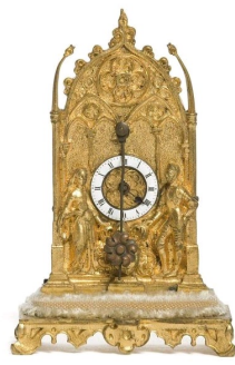
Pendule Troubadour, 1835-1850, Musée des Arts Décoratifs, Paris.