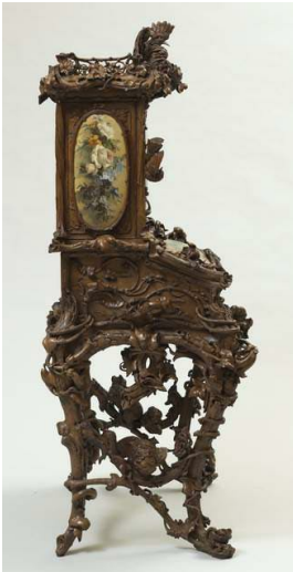
Bonheur du jour de l'Impératrice Eugénie, présenté à l'Exposition Universelle de 1855, Château de Compiègne.