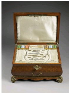
Nécessaire à couture, Château de Compiègne.