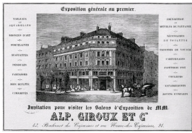
Invitation d'Alphonse Giroux et Cie, 1857-1867