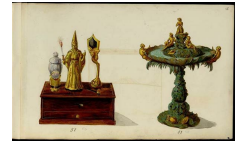
Projet de jouet et de fontaine, Album Giroux, Musée des Arts Décoratifs, Paris.