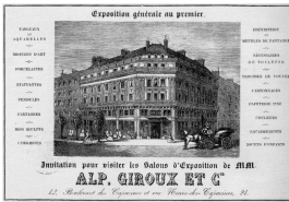
Invitation d'Alphonse Giroux et Cie, 1857-1867