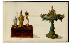
Projet de jouet et de fontaine, Album Giroux, Musée des Arts Décoratifs, Paris.