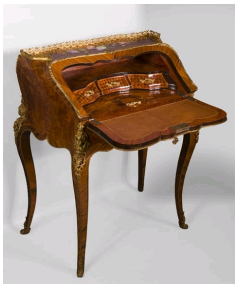
Bureau de pente incrusté des porcelaines de Rivart et signé par Alphonse Giroux, Galerie Marc Maison.