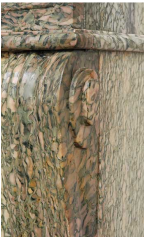
Détail de Campan Rose et Vert