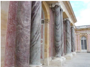
Colonnes en Campan Grand Mélange dans la cour de Trianon