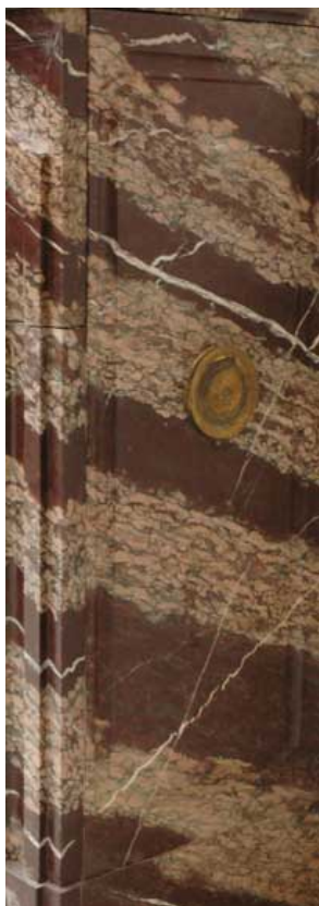
Détail de Campan Rubané