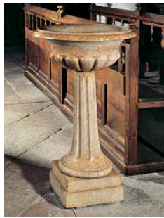
Le bénitier de l'église de Moirans-en-Montagne en marbre Jaune Lamartine.