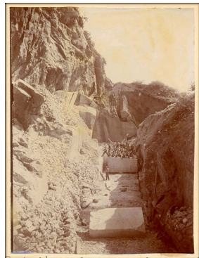
Photographie ancienne de la carrière de Champied à Pratz, Jura, où était extrait le marbre Jaune Lamartine.