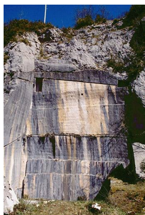
La carrière de Champied à Pratz, Jura.