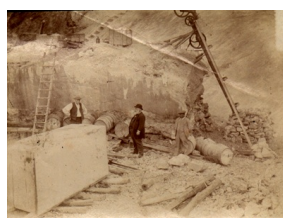
Une carrière de Pratz au début du XX e siècle.