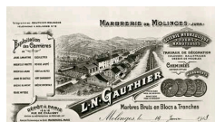
Compagnie de la Marbrerie de Molinges, publicité ancienne.