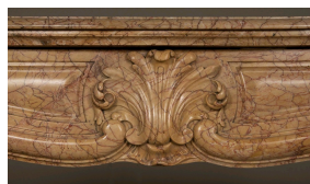
Une cheminée de style Louis XV réalisée en marbre Jaune Lamartine. Galerie Marc Maison.