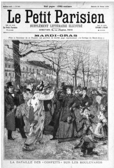
Bataille de confetti et arbres enrubannés de serpents sur les Grands Boulevards en 1896.

Dans ces immeubles, la part belle est faite aux intérieurs et à leur décoration, notamment par l'ajout de belles cheminées en marbre de styles Louis XV, Louis XIV ou encore Louis XVI, celles qui seront appelées « Cheminées haussmanniennes ».