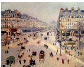
Camille Pissarro, Avenue de l'Opéra, 1898, Musée des Beaux-Arts de Reims.

Georges Eugène Haussmann (1809-1891) , qui se fit appeler Baron suite à son élection au Sénat en 1857, est notamment connu pour avoir été préfet du département de la Seine de 1853 à 1870. Durant cette période, il a imaginé et dirigé les grands aménagements de Paris sous les ordres de Napoléon III .