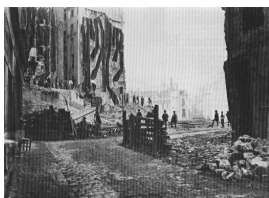
Le percement de l'avenue de l'Opéra.