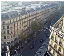
Boulevard Haussmann, Paris.