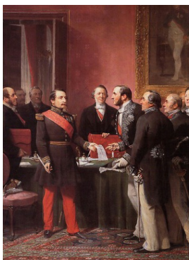
Adolphe Yvon, Napoléon III remettant au baron Haussmann le décret d'annexion à Paris des communes suburbaines le 16 février 1859, 1865, Musée Carnavalet.