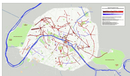
Les principaux axes créés ou transformés sous le Second Empire et au début de la Troisième République.