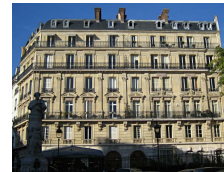
Façade d'un immeuble haussmannien Place Saint Georges à Paris.