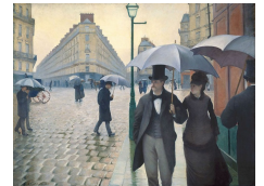
Gustave Caillebotte, Rue de Paris, temps de pluie, 1877, Art Institute, Chicago.