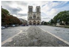
Le Parvis de Notre-Dame, place Jean-Paul II.