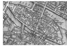
L'île de la Cité et son tissu urbain médiéval avant les travaux haussmanniens (plan Vaugondy de 1771).