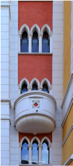
Détail de la façade, château des Ollières.