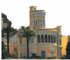
Le château de La Tour, édifié pour Maximilien Budai, 1880, Mont Boron, Nice.