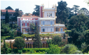
Le château des Ollières, colline des Beaumettes, Nice