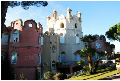
Château de l'Anglais, édifié pour le colonel Smith, 1858, Mont Boron, Nice.