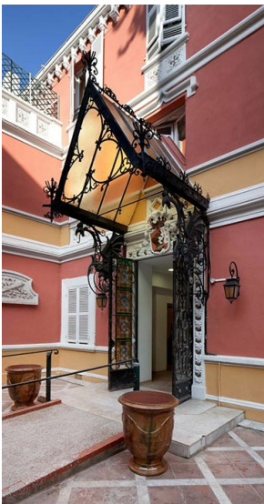
Portail du château des Ollières.