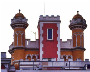
Tours crénelées, château des Ollières.