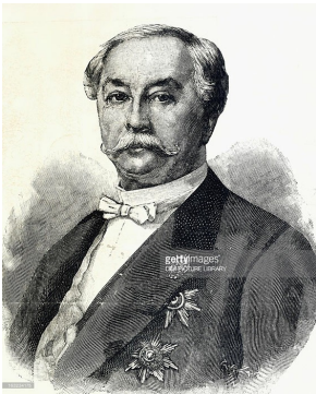
Le prince Alexei Lobanov-Rostovsky, Getty Images.