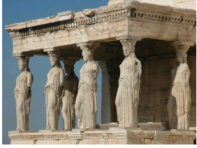
Les célèbres cariatides de l'Erechthéion de l'Acropole d'Athènes, fin du V e siècle avant JC.

Une cariatide ou caryatide est une statue de femme généralement vêtue de longue tunique soutenant un entablement sur sa tête, que l'on place en guise de colonnes, de piliers ou de pilastres. Ce nom, qui signifie habitant de Caryes, situé en Laconie, viendrait de l'alliance des habitants de cette ville avec les Perses lors de l'invasion des Grecs. Ces derniers les exterminèrent et réduisirent leurs femmes en esclavage, les condamnant à porter les plus lourds fardeaux.