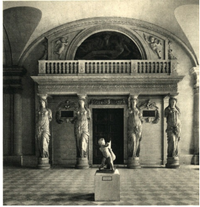
Tribune des Cariatides par Jean Goujon, 1550, Musée du Louvre, Paris.