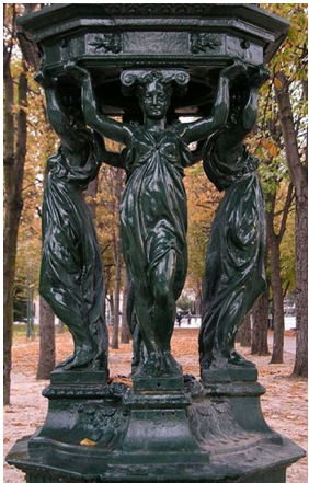
Fontaine Wallace à Paris aux sensuelles cariatides aux drapés mouillés, XIX e siècle.