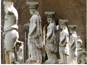
Les cariatides de la Villa d'Hadrien à Tivoli, II e siècle.

Cependant, il apparaît que le motif de la cariatide soit plus ancien que les guerres médiques décrites par Vitruve.