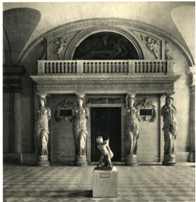
Tribune des Cariatides par Jean Goujon, 1550, Musée du Louvre, Paris.

En architecture, l'équivalent masculin de la cariatide est un atlante ou un télamon. Le terme dérive du nom du titan grec Atlas (en grec ancien « le porteur »), condamné par Zeus à soutenir les cieux jusqu'à la fin des temps. Les atlantes sont formés de figures d'hommes debout ou agenouillés, et étaient employés dans certains temples grecs. Ces éléments architecturaux portent plutôt le nom de télamons dans les temples romains.