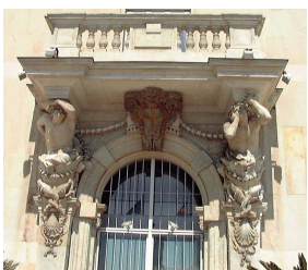
Les atlantes de Pierre Puget pour l'Hôtel de Ville de Toulon, 1657.