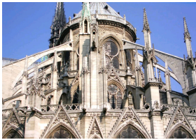
Arcs boutants extérieurs de la Cathédrale Notre-Dame de Paris construite à partir de 1163.