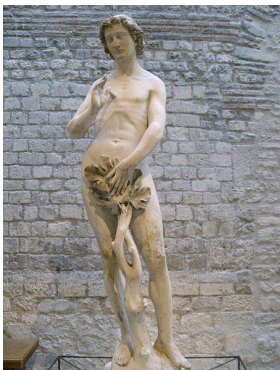
« Adam », statue ornant Notre-Dame de Paris et conservée aujourd'hui au Musée de Cluny.

Suivant le style Roman, le style Gothique embrasse une période vaste allant du XIIe au XVe siècle .