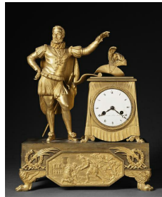
pendule Henri IV, v. 1820, Château de Pau.