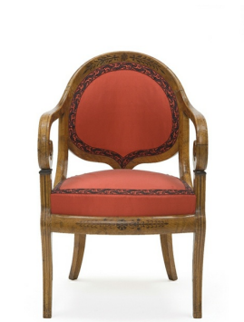
Fauteuil gondole exposé en 1827 par François Baudry, pour lequel Charles X lui remit la médaille de bronze. Hêtre, frêne, incrustation d'amarante. Musée des Arts Décoratifs, Paris.