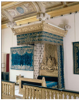
Pierre-Gaston Brion, Lit de Charles X aux Tuileries, modèle de Saint-Ange, 1824. Musée du Louvre, Paris.