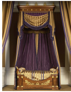
Lit de la duchesse de Berry dans sa chambre aux Tuileries, 1820. Conservé au château de Compiègne.