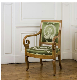
Fauteuil Charles X, 1830, musée Mangin, Dijon.