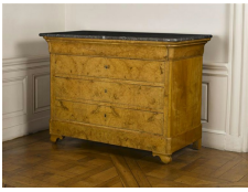
Commode Charles X, 1830, musée Mangin, Dijon. Corniche en doucine, plateau en marbre.