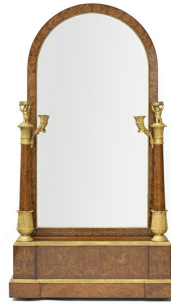
Félix Frémond, Psyché formant boîte à musique, exposée en 1823 et achetée par la duchesse de Berry pour les Tuileries. Chêne, placage d'orme, incrustations de frêne et de citronnier, bronze doré. Musée des Arts Décoratifs, Paris.