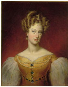
Paulin Jean-Baptiste Guérin, Portrait de la duchesse de Berry, 1816. Château de Versailles.