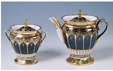
Théière et sucrier décoré d'ogives, porcelaine, vers 1820. Musée national Adrien Dubouché, Limoges.