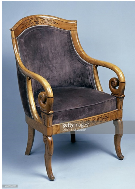
Fauteuil gondole, 1824-1830, en érable et incrustations d'amarante.