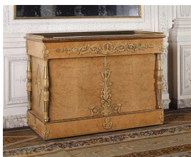
Jean-Jacques Werner, commode achetée par Charles X en 1827 pour le Trianon. Château de Versailles.

Après le 1er Empire, emporté dans l'achute de Napoléon Ier , la monarchie est rétablie en France de 1815 à 1830. Les arts décoratifs se débarrassent alors des emblèmes de l'Empire et réemploient librement des motifs issus du style Louis XVI et du style Directoire, ainsi des palmettes et pattes de lions, en allégeant considérablement les ornements. Le style Restauration oppose ainsi généralement la souplesse et la subtilité à l'ostentation.