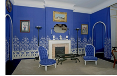
Armand-Albert Rateau, Chambre de l'hôtel particulier Art Déco de Jeanne Lanvin, vers 1925. Paris, Musée des Arts Décoratifs.