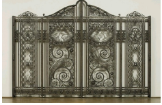
Paul Kiss, Grille « Les faisans », présenté lors de l'Exposition Internationale des Arts décoratifs et industriels modernes de Paris en 1925. Paris, Musée des Arts Décoratifs.