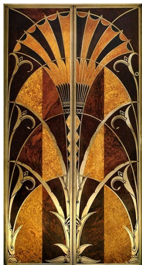
William van Alen, Portes d'ascenseur du Chrysler Building, 1930, New-York.