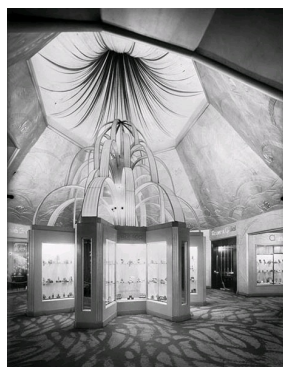
Vibert frères, La parfumerie, salle de l'Exposition internationale des arts décoratifs et industriels modernes, 1925.