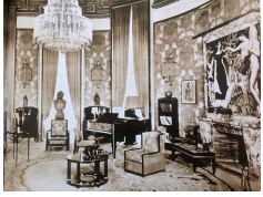
Emile-Jacques Ruhlmann, « Pavillon du collectionneur », Exposition internationale des Arts décoratifs et industriels modernes de Paris en 1925.

René Lalique, porte d'entrée du Pavillon Lalique à l'Exposition internationale des Arts décoratifs et industriels modernes de Paris en 1925. Musée des Arts Décoratifs, Paris.