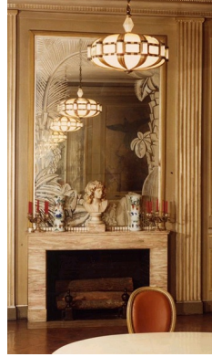
Baguès frères, Salle à manger de l'hôtel Fels, Paris, 1926.