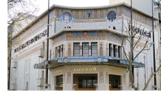
Henri Zipcy, cinéma Le Louxor, mosaïque de Gentil et Bourdet, 1921, Paris.