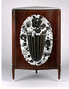
Emile-Jacques Ruhlmann, Cabinet d'angle, vers 1923, Brooklyn Museum, New-York.