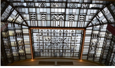
Auguste Martin, Grande verrière des Nouvelles Galeries, 1927, Angers.