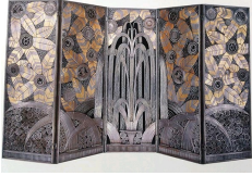
Edgar Brandt, paravent Oasis exposé à l'Exposition des Arts Décoratifs de 1925 à Paris