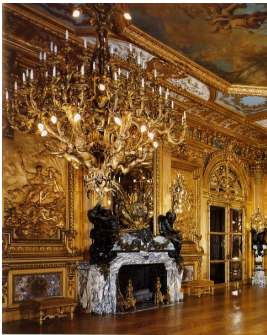
Photo n°1 : La grande cheminée de Marble House est encadrée de bas-reliefs en bois doré, dus à Louis Ardisson.