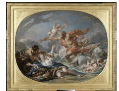
Photo n°11 : Boucher François (1703-1770), Neptune poursuivant la nymphe Amymone, 1764, huile sur toile, Versailles, Châteaux de Versailles et de Trianon.