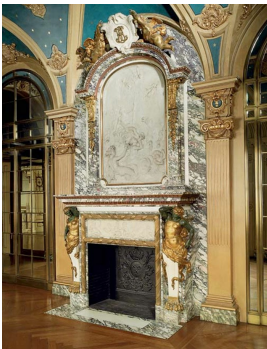
Photo n°3 : Extraordinaire cheminée monumentale de Jules Allard et Louis Ardisson provenant de l'Hôtel particulier des Berwind, New York