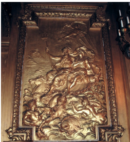
Photo n°2 : Louis Ardisson a représenté un Triomphe de Neptune et d'Amphitrite. Cette composition est peut-être inspirée d'un plafond de Charles Lebrun au palais du Louvre.