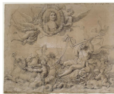
Photo n°8 : Pierre Mignard (1612-1695), Neptune offre à Colbert la domination des mers, Dessin pierre noire, rehauts de blanc sur papier lavé de beige, Musée du Louvre.