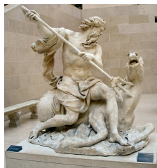
Photo n°13 : Antoine Coysevox (1640-1720), Neptune, 1705, marbre, 185,5 x 117 x 111 cm. Paris, Musée du Louvre (à l'origine dans le Parc de Marly).