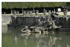
Photo n°14 : Adam Lambert Sigisbert (1700-1759), Neptune brandissant son trident, Amphitrite recevant les richesses de la mer que lui présente une Naiade, sur le char marin accompagnés de Tritons et de monstres marins, 1736-1740, sculpture en plomb monumentale du Château de Versailles de 4,5 x 7,4 mètres.