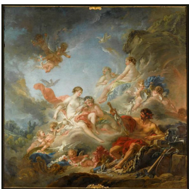
Photo n°4 : François Boucher (1703-1770), Les Forges de Vulcain ou Vulcain présentant à Vénus les armes pour Enée, 1757, musée du Louvre.