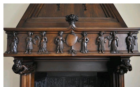
Cheminée monumentale à décor de scènes Troubadour, XIXe siècle, Galerie Marc Maison.