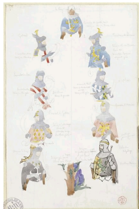
Eugène-Emmanuel Viollet-le-Duc, esquisse pour le décor de la cheminée de la chambre de l'Impératrice au Château de Pierrefonds, vers 1857, Médiathèque de l'Architecture et du Patrimoine, Charenton-le-Pont.