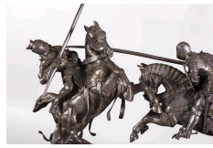
Comte de Nieuwerkerke, La mort du Duc de Clarence, 1838, Galerie Marc Maison.