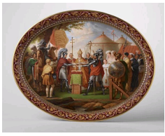
Plat du déjeuner Duguesclin, 1835, peinture d'après Alexandre-Evariste Fragonard, Sèvres, Cité de la céramique.