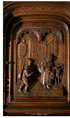
Scène troubadour sculptée sur un buffet de style Néo-Renaissance, vers 1880, Galerie Marc Maison.