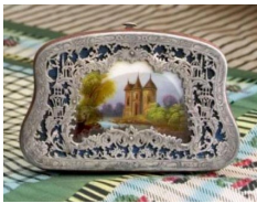
Porte monnaie, vers 1852-1870, Palais Galliera, musée de la Mode de la Ville de Paris.