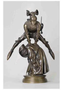
Gustave Doré, Joyuseté, 1881, Paris, Musée d'Orsay.