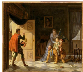
Pierre Révoil, Henri IV jouant avec ses enfants, 1817, Musée national du Château de Pau.