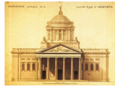
Élévation principale de la nouvelle église de Sainte-Geneviève, dessin de Soufflot après 1764, Archives nationales, Paris.