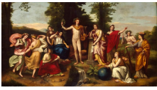
Raphaël Mengs, Le Parnasse, Villa d'Albani, Rome, milieu du XVIIIe siècle