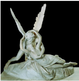
Antonio Canova, Psyché ranimée par le baiser de l'Amour , 1793, Musée du Louvre, Paris.