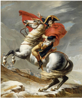
Bonaparte franchissant le Grand-Saint-Bernard, portrait peint par Jacques-Louis David, entre 1800 et 1803, Musée national du Château de Malmaison, Rueil Malmaison.