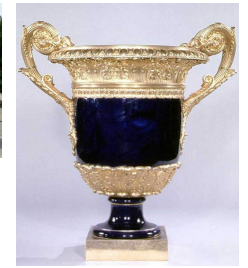
Vase néoclassique, Jacob Petit, vers 1830, Musée du Louvre