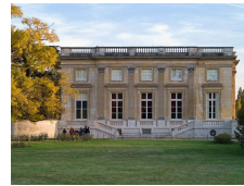
Petit Trianon, Versailles, Jacques Ange Gabriel 1762-68