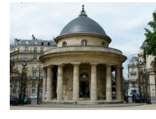
Barrière de la rotonde de Chartres, par Claude-Nicolas Ledoux pour l'enceinte des Fermiers généraux, 1786-1792, parc Monceau, Paris.