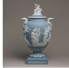
Vase de John Flaxman, fabriqué par Josiah Wedgwood and Sons, 1782-1790, Metropolitan Museum, New York.