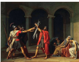
Serment des Horaces, Jacques Louis David, 1784, Musée du Louvre.