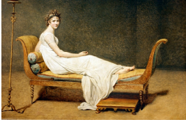
Jacques-Louis David, Portrait de madame Récamier , 1800, Musée du Louvre, Paris.